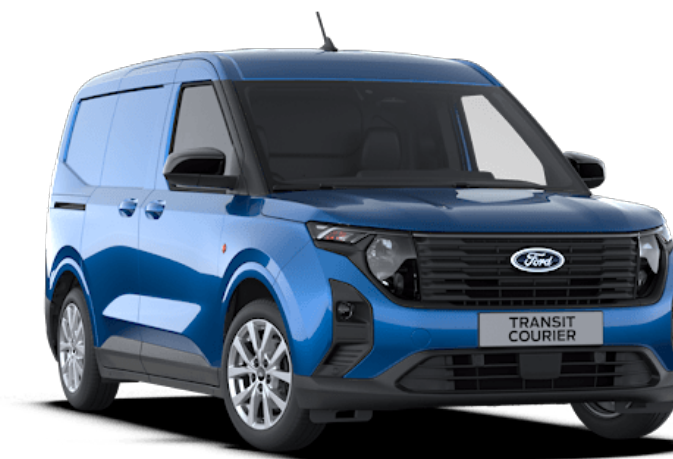
Desert Island Blue Vernice carrozzeria metallizzato*