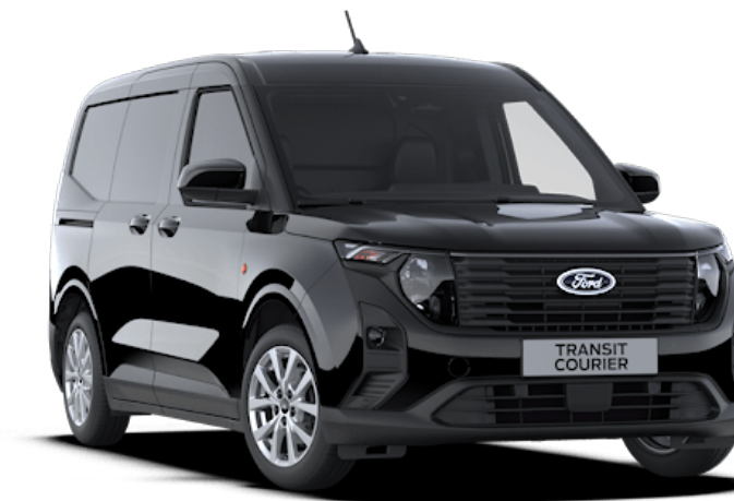
Agate Black Vernice carrozzeria metallizzato*