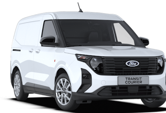
Frozen White Vernice carrozzeria solido