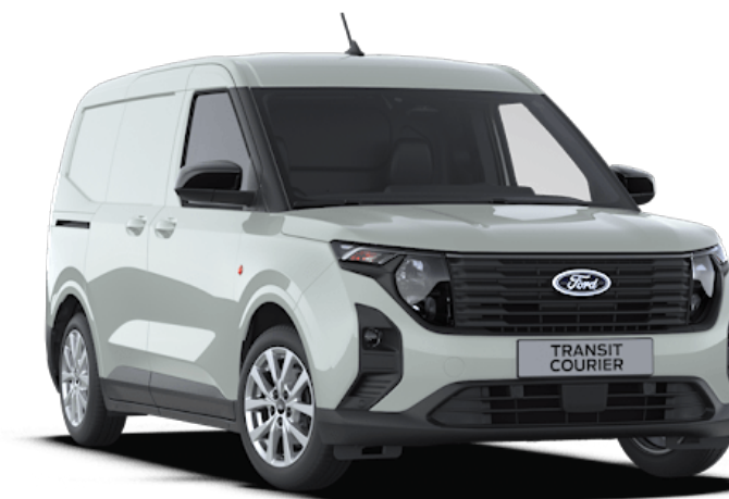
Cactus Grey Vernice carrozzeria solido