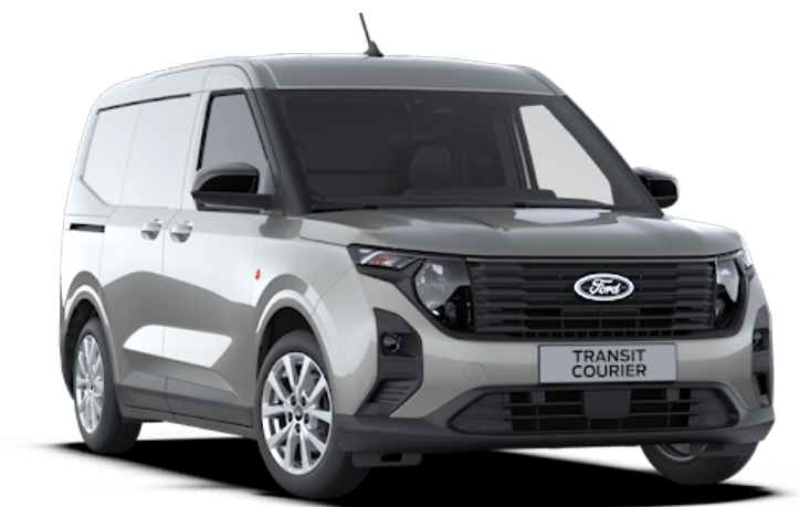
Solar Silver Vernice carrozzeria metallizzato*

Nota Le immagini dei veicoli utilizzate illustrano solo i colori carrozzeria e potrebbero non corrispondere alle caratteristiche correnti o alla disponibilità prodotto in alcuni mercati. I colori e le rifiniture riprodotti in questa pubblicazione possono variare dai colori reali a causa dei limiti e della varietà di opzioni visualizzazione utilizzate.