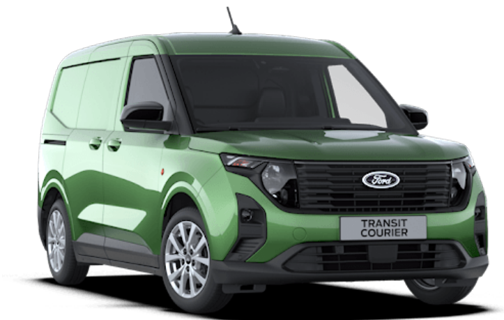
Bursting Green Vernice carrozzeria metallizzato*