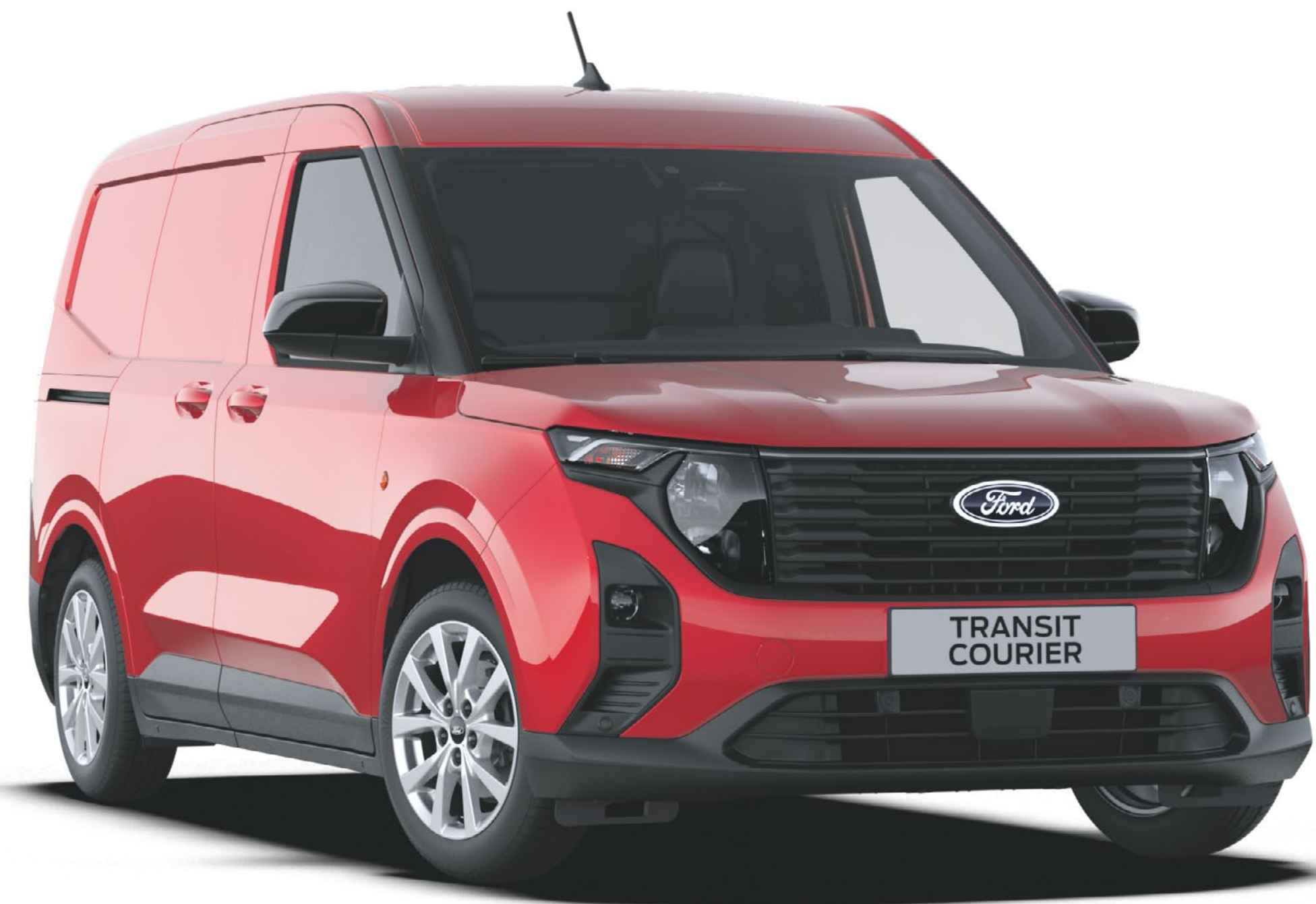
Fantastic Red Special Vernice carrozzeria metallizzato*

Transit Courier Van permette di essere creativi grazie ad una scelta di colori eleganti, classici e moderni.